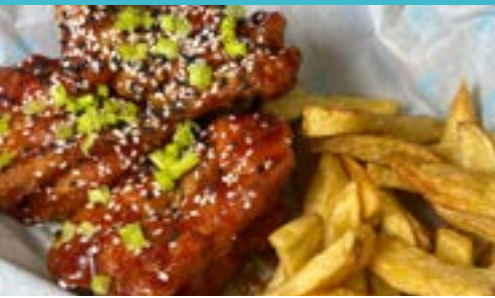
Pollo Frito Coreano Korean Fried Chicken