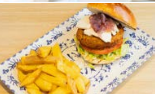
Hamburguesa Veggie de Lentejas Lentil Veggie Burger