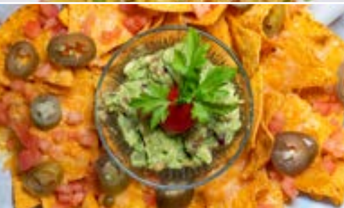
Nachos con Guacamole Casero, Queso Cheddar, y Jalapeños Nachos with Homemade Guacamole, Cheddar, and Jalapeno Peppers