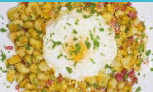
Habitas Baby con huevo y jamón Baby broad beans and jamon