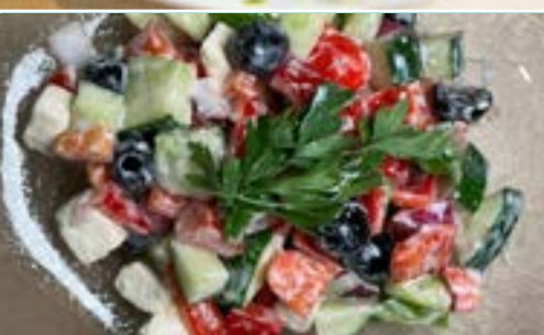
Ensalada Griega con Queso Feta y Salsa de Yogur Greek Salad with Feta Chefsse and Yogurt Dressing