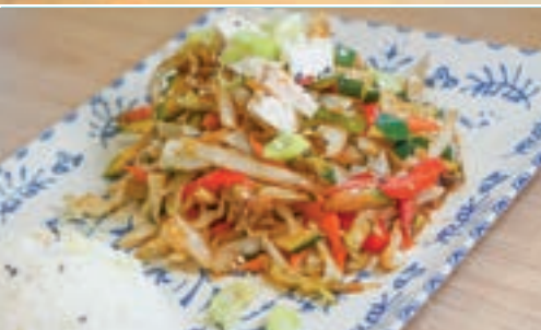
Salteado de Verduras Mixtas, Tofu y Soja estilo Japonés Japanese Style Mixed Vegetables and Tofu Stir Fry