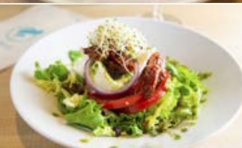
Ensalada de Burrata Fresca y Tomate Seco con Pesto de Almendras Casero Fresh Burrata Salad with Sun-Dried Tomatoes and Homemade Almond Pesto Sauce