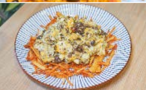
Revuelto de Morcilla Scrambel egg with spanish blood sausage