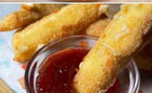
Crujientes de Queso Camembert con Mermelada de Fresa Crispy Camembert Cheese with Strawberry Sauce.