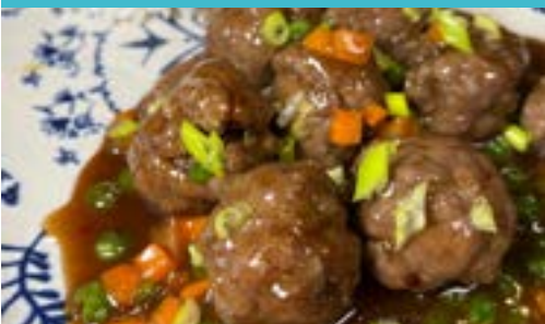
Albondigas al Pedro Ximenez Pedro Ximenez Meatballs