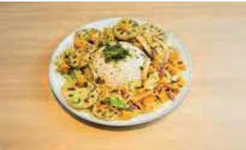
Curry Verde Thai con Verduras Salteadas Thai Green Curry with Mixed Vegetables