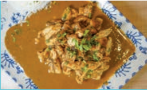
Pollo curry con leche de coco y setas Coconut Curry with Chicken and Mushrooms