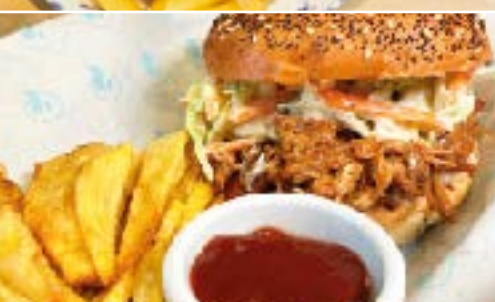
Hamburguesa Pulled Pork Pulled Pork Burger