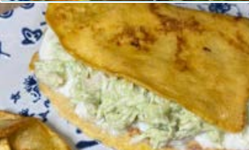
Cachapa Reina Pepiada Reina Pepiada Cachapa