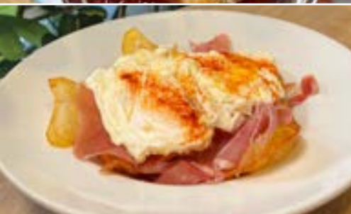
Huevos rotos con jamón "Broken eggs" with jamon