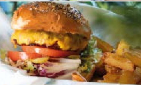
Hamburguesa FLAME con Mayonesa de Pimiento Rojo Asado FLAME Burger with Roasted Red Pepper Mayonnaise